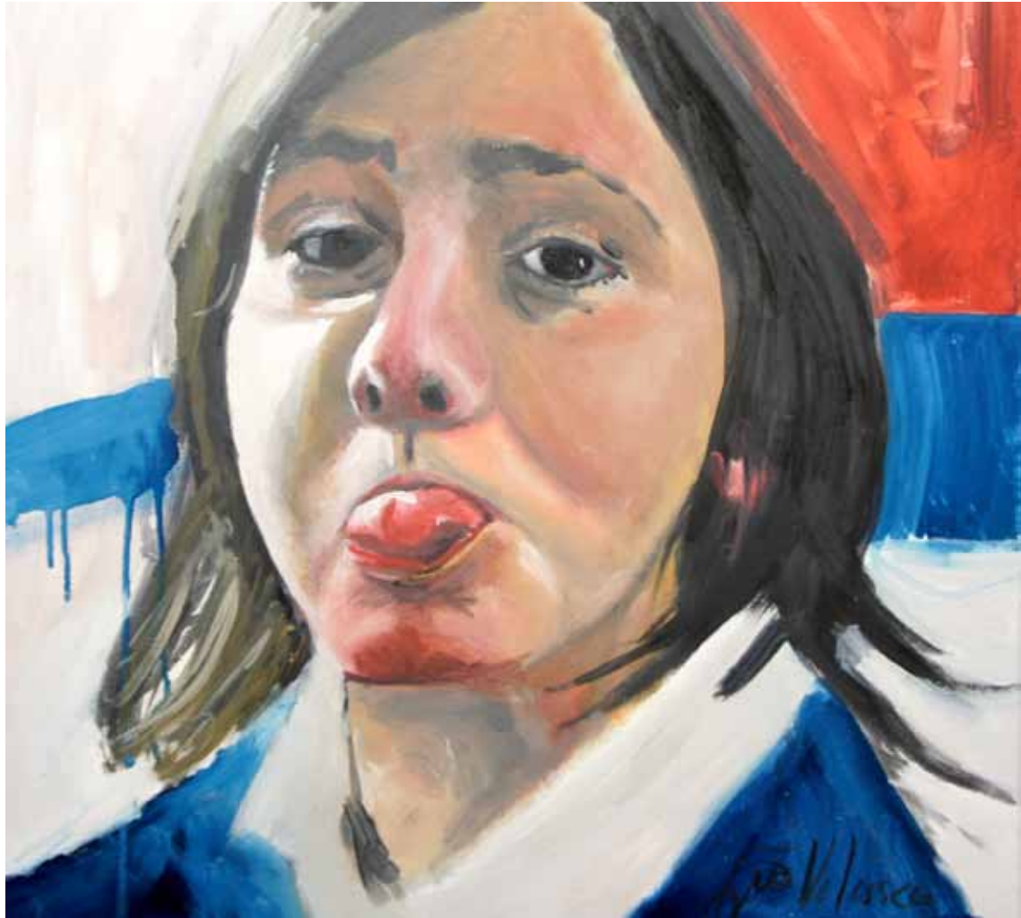
Ensayo sobre la burla 5 Óleo sobre lienzo, 60 x 60 cm