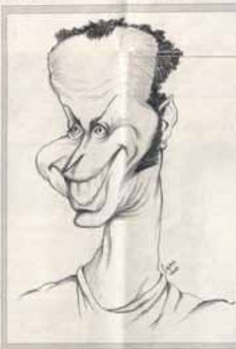
«Los empresarios asturianos aún no conciben tener que invertir dinero en dar una buena imagen de sus negocios»

«¿Se prometió desde la Administración la creación de este tipo de empresas que dan salida a los jóvenes?» «¿Cómo que más que comprometidos desde la creación de la Administración de Asturias, a lo que se le ha dedicado una oficina y un presupuesto de un millón de pesetas para su promoción en los que vienen.»