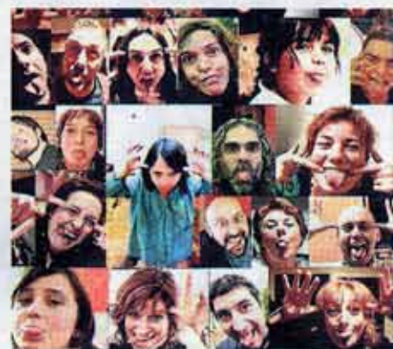
Varios de los cuadros elaborados por el artista Toño Velasco.

do algo con las el agua: se de Blando. A Va, pero una labio en la la Plaza, en el hombre y de Carlos, un de los los con un que se Cito que de la que se de los de los de los de los