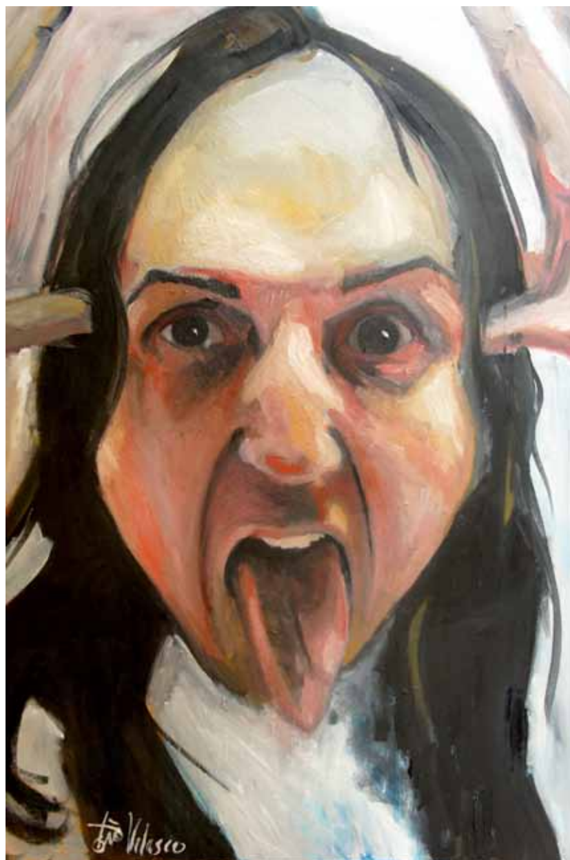
Ensayo sobre la burla 4 Óleo sobre lienzo, 100 x 73 cm