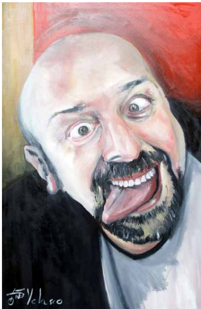
Ensayo sobre la burla 11 Óleo sobre lienzo, 90 x 70 cm