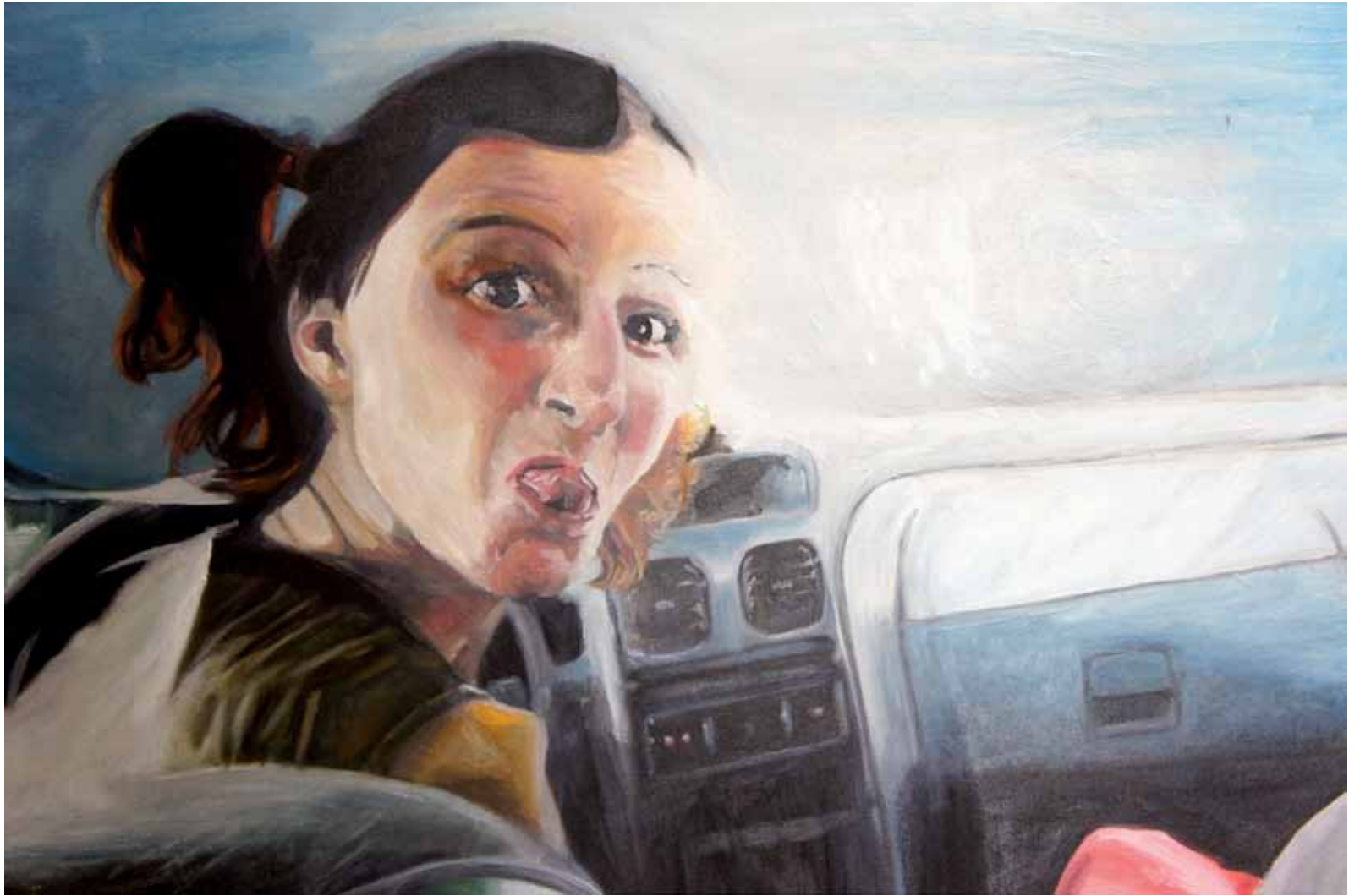
Ensayo sobre la burla 2 Óleo sobre lienzo, 91 x 73 cm