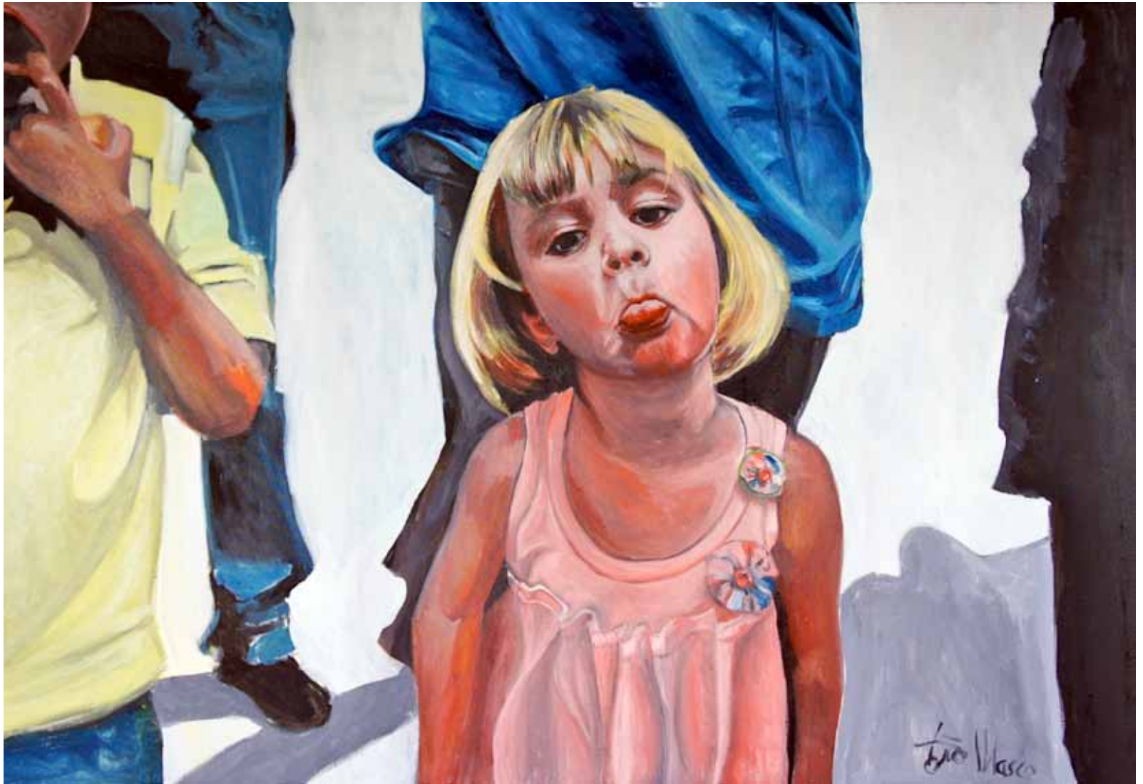
Ensayo sobre la burla 15 Óleo sobre lienzo, 130 x 90 cm