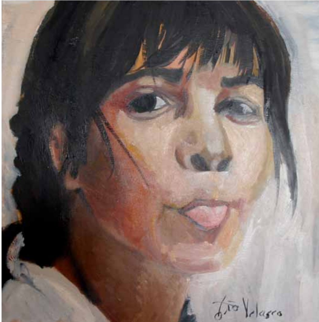
Ensayo sobre la burla 5 Óleo sobre lienzo, 60 x 60 cm