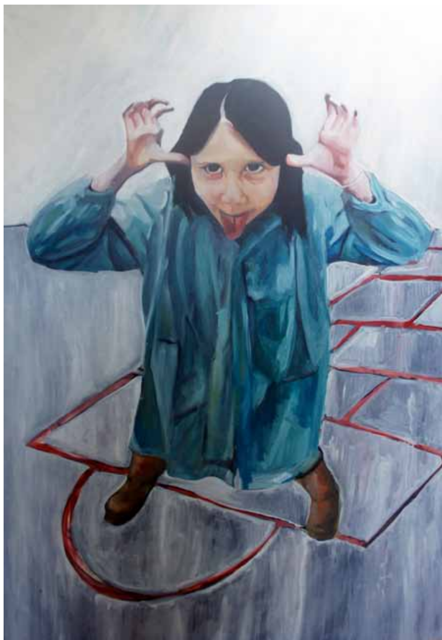
Ensayo sobre la burla 14 Óleo sobre lienzo, 160 x 114 cm