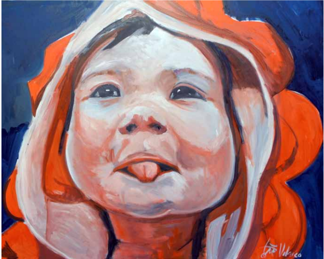
Ensayo sobre la burla 15 Óleo sobre lienzo, 93 x 73 cm