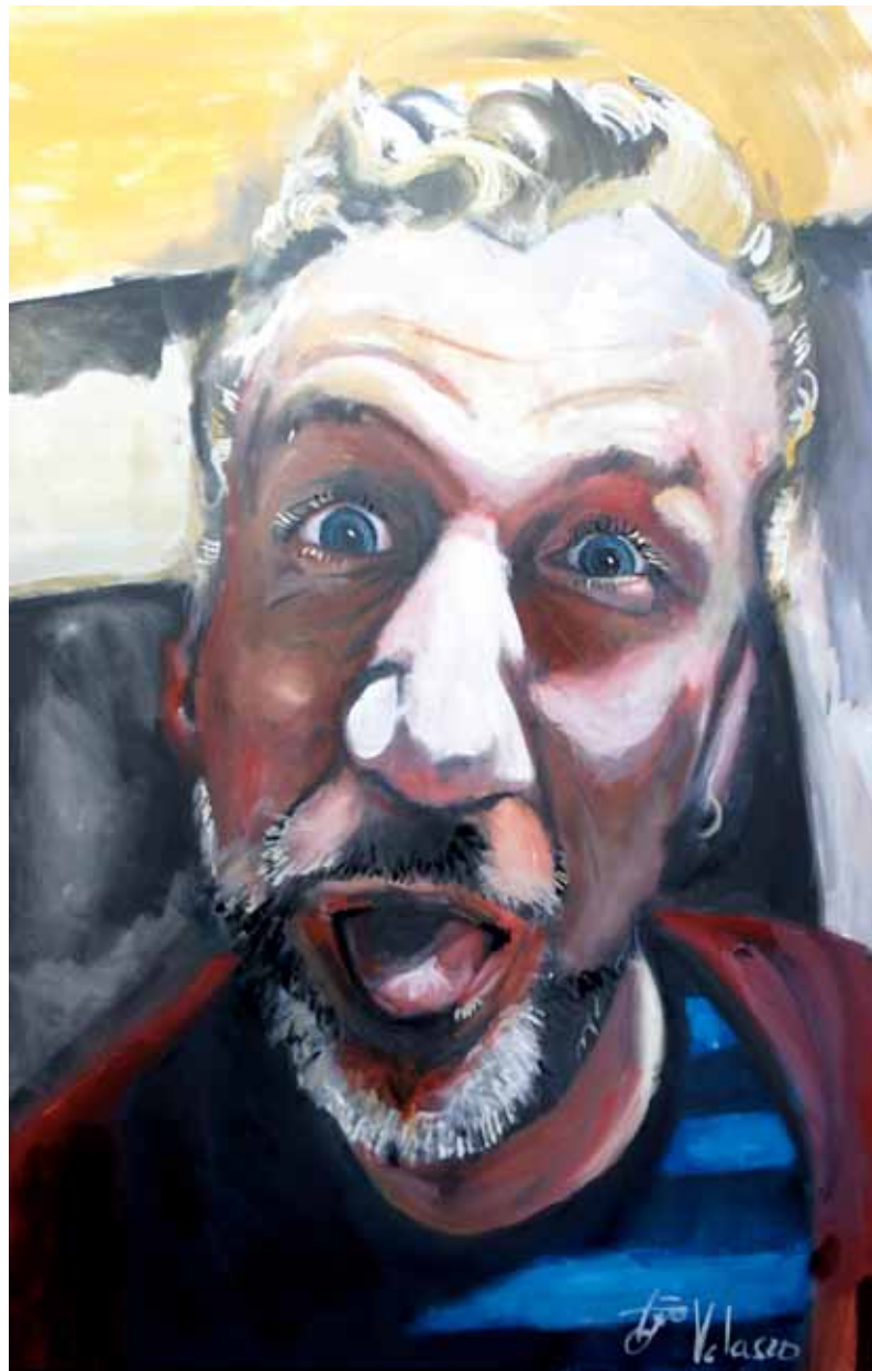
Ensayo sobre la burla 10 Óleo sobre lienzo, 90 x 70 cm