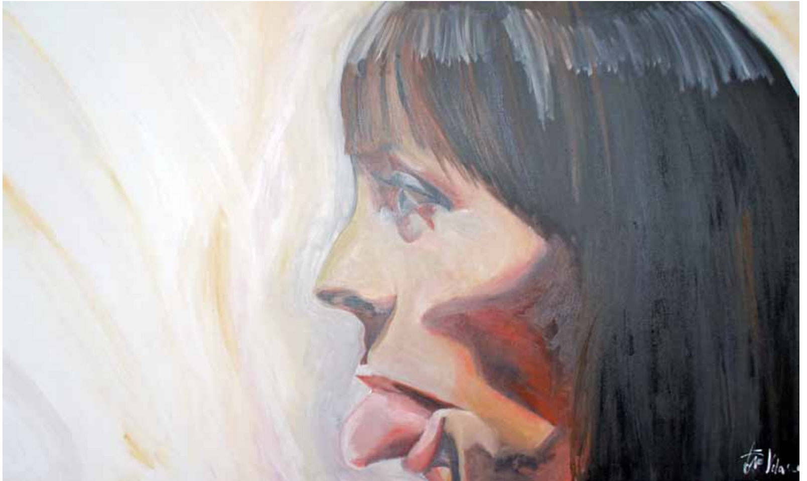
Ensayo sobre la burla 13 Óleo sobre lienzo, 167 x 97 cm