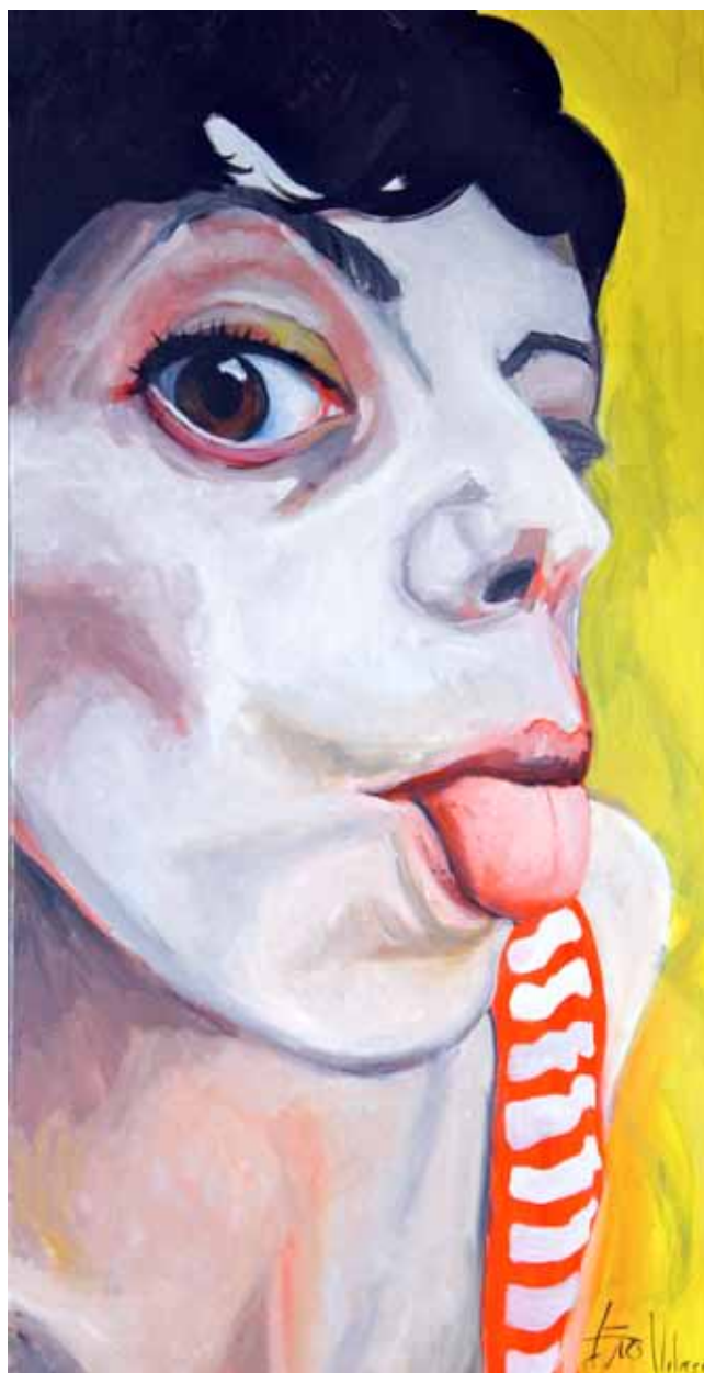
Ensayo sobre la burla 16 Óleo sobre lienzo, 100 x 50 cm