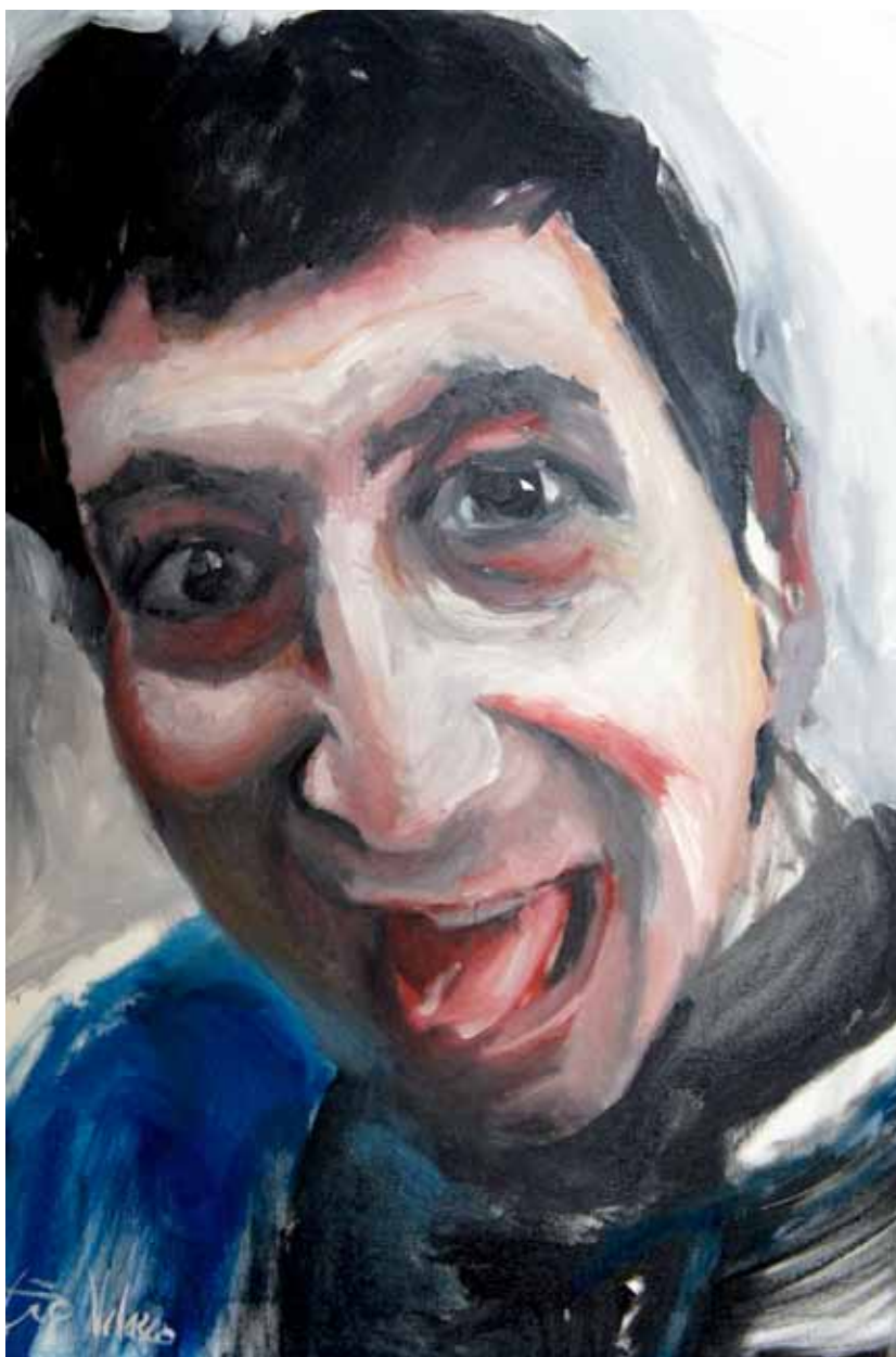
Ensayo sobre la burla 3 Óleo sobre lienzo, 90 x 73 cm