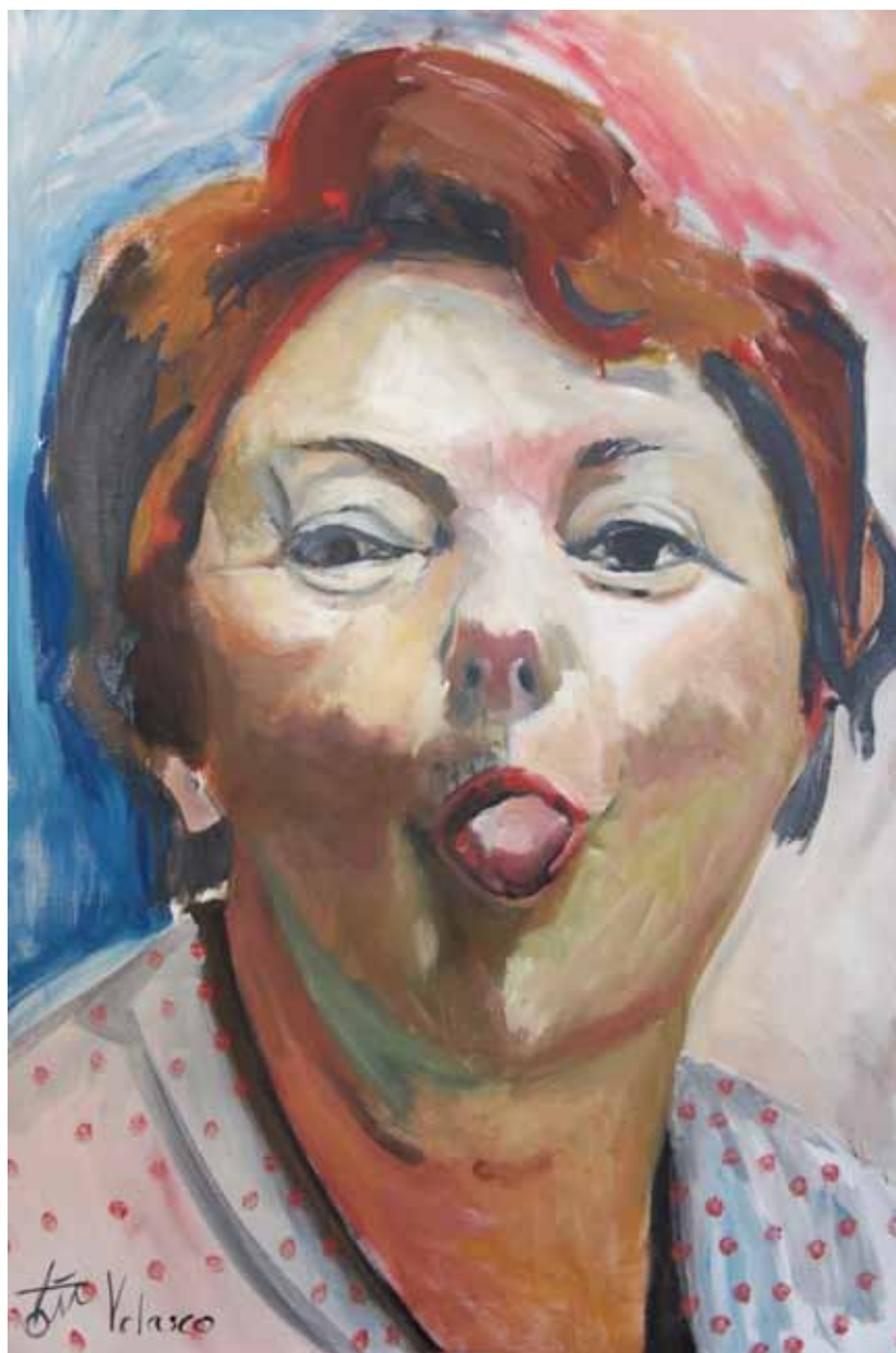
Ensayo sobre la burla 6 Óleo sobre lienzo, 100 x 73 cm