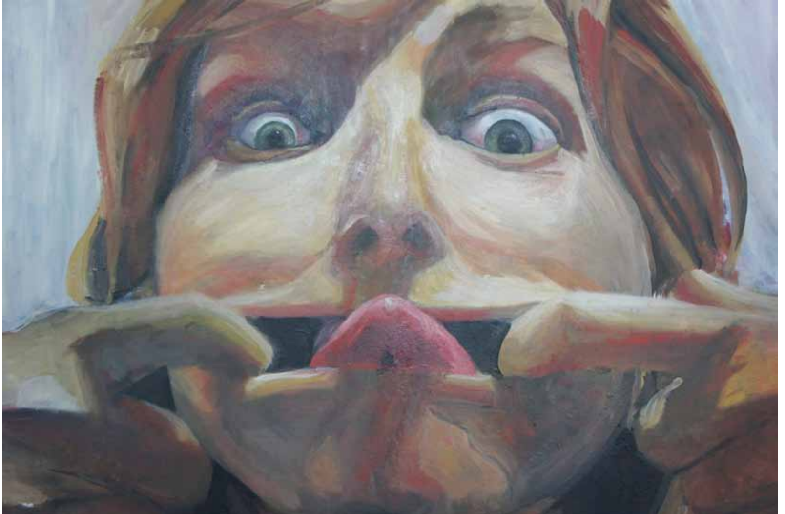
Ensayo sobre la burla 1 Óleo sobre lienzo, 100 x 81 cm