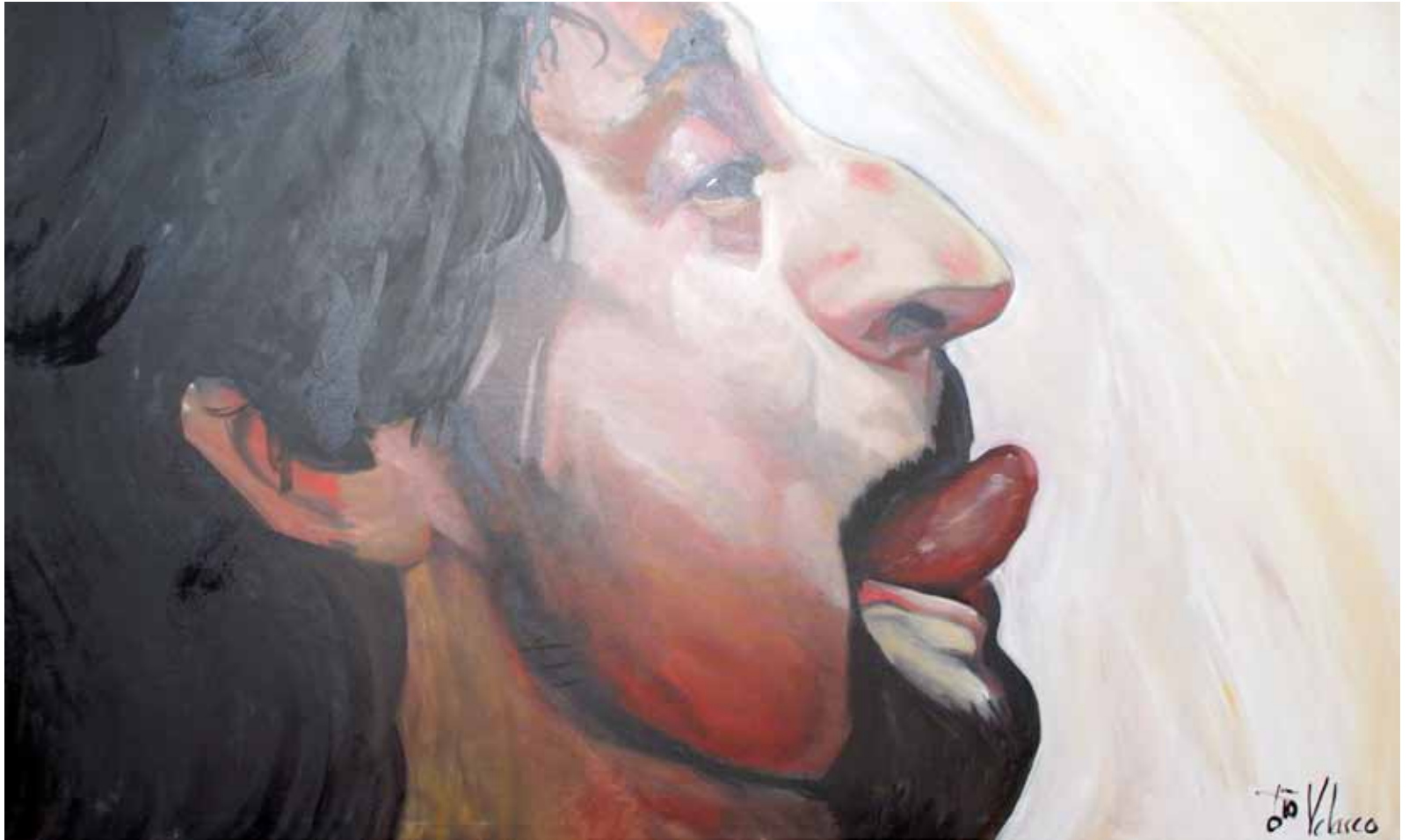
Ensayo sobre la burla 12 Óleo sobre lienzo, 167 x 97 cm